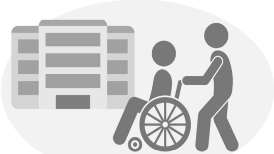
受診時や医療機関・ 高齢者施設などを訪問する時