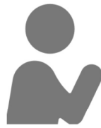
慢性肝臓病 がん 心血管疾患 など