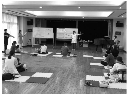
(みんなであつたいましよう)