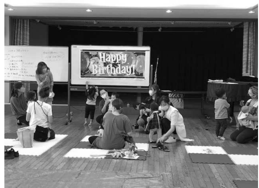
(お誕生日をみんなでお祝いしよう)