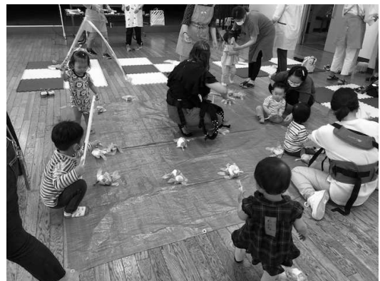
(お母さんと一緒にお魚釣り)