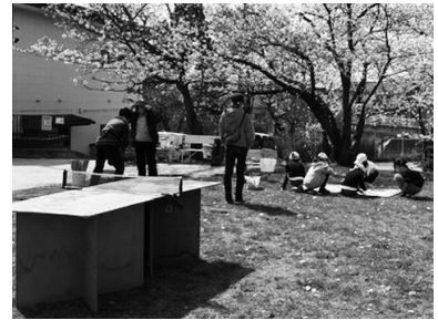
ダンボール製の卓球台