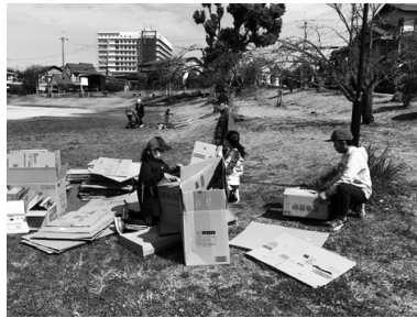
ダンボールで小屋づくり