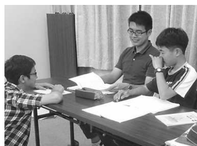
<勉強も大学生のお兄さんと>

「月曜・夜ごはんの会」にボランティア参加してくれていた学生さんのサークル「ポコアポコ」が活動の1つとして、運営にかかわってできるようになり、「月曜ポコアポコの家」と名前を変更。毎週月曜日、第1集会所は、小学校高学年・中学生と大学生の、あたたかな場所になりました。大学生は、遊びの仲間、勉強を教えてくれる人、という以外に、ちょっと相談したり、ちょっと先の自分をイメージ出来る先輩でもあります。