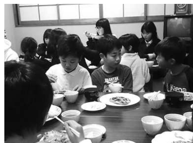
<皆と一緒に楽しい食事>

今から8年前の夏休み。第1集会所を借り、羽曳が丘町会連合会の後援も受け、「夏休みこどもの家実行委員会」が主催する「夏休みこどもの家」が開かれました。夏休みの後半の1週間、朝から夕方まで、子どもたちは遊んだり、工作をしたり、絵を描いたり、環境の勉強もしました。当時の実行委員会は「木育情報ネット」を中心に、保育士グループ、羽曳が丘住民ボランティアなどで構成。