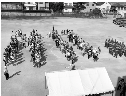
訓練に集まった住民の方々

主催：羽曳が丘町会連合会・羽曳が丘安全委員会 協力団体：羽曳野市・羽曳野市消防団 羽曳野市社会福祉協議会・社会福祉法人四天王寺悲田院・羽曳野無線クラブ