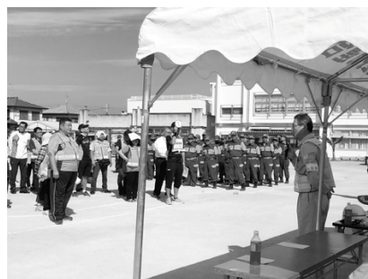
浦田町会連合会長の挨拶