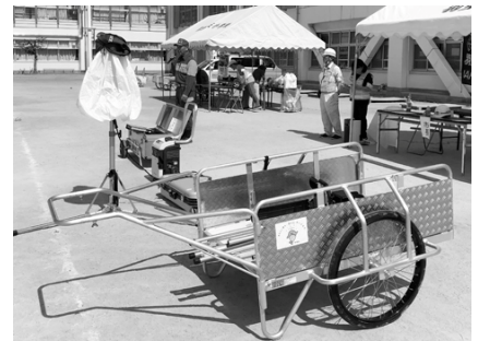
備えられる防災グッズの展示