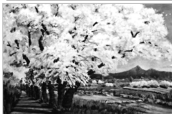
水彩画 秋月オサム