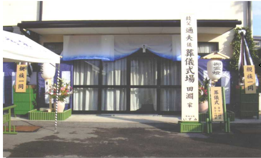
第一集会所の標準葬儀

この標準葬儀は「虚礼廃止」「簡素化」「低価格」の合理的な葬儀です。最近の葬儀では虚礼廃止による香典の辞退が多くなっており、香典に代えて、会葬者から喪主への弔意を表す一対2000円の「標準密」を設定し、密の印刷掲示・会葬者へのお礼状などで対応しています。